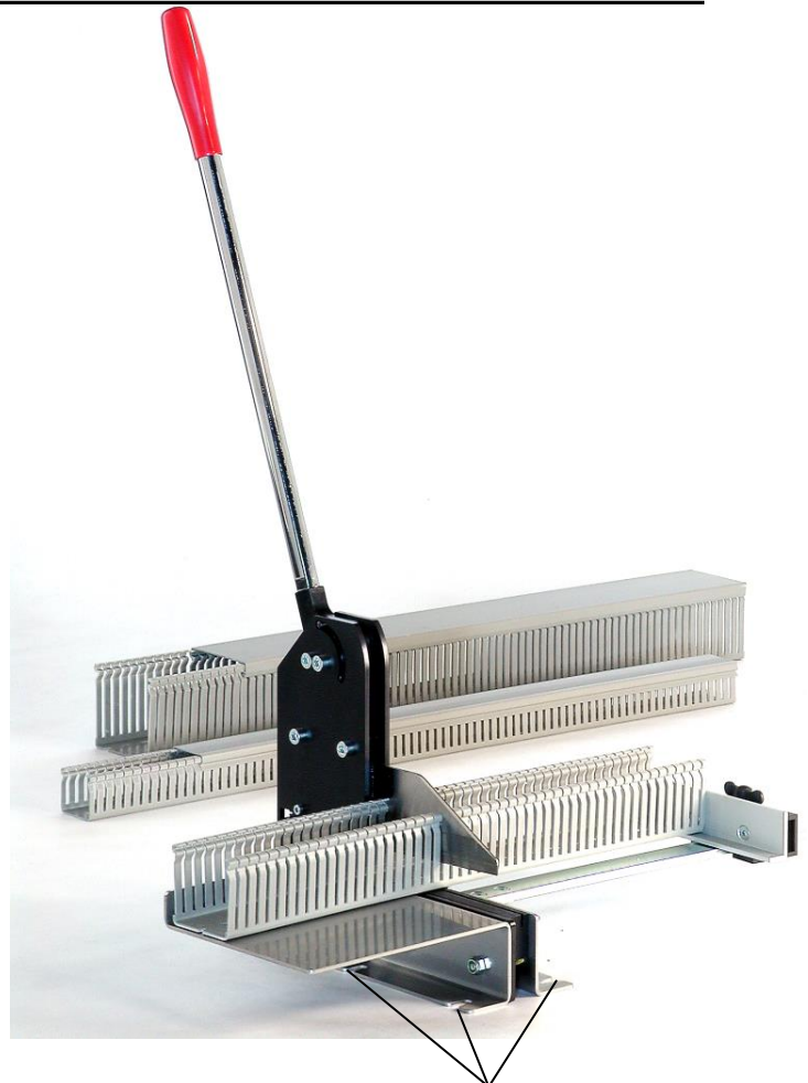
Einfache Montage auf der Werkbank